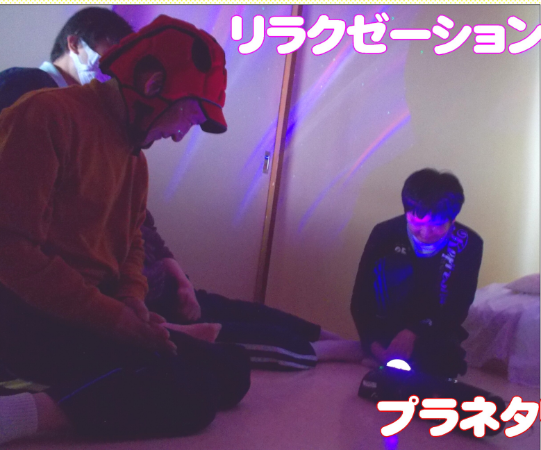
リラクゼーション...