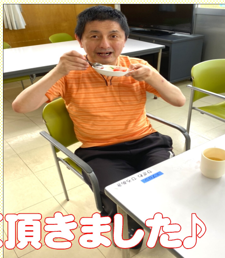
夏の風物詩スイカ!! おいしく頂きました♪