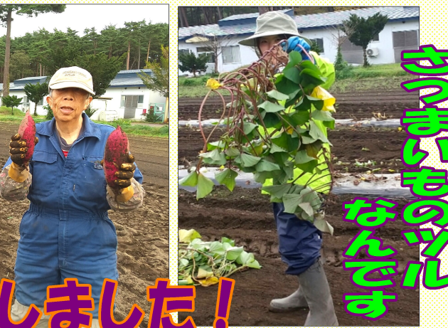
皆でさつまいもを収穫しました!