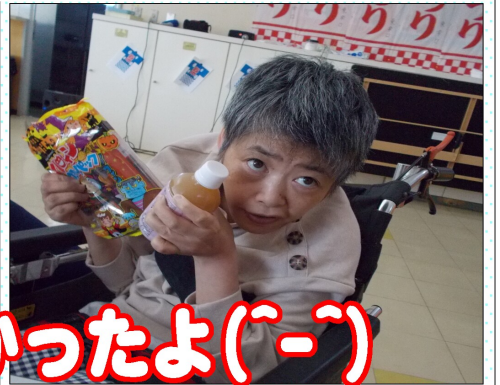
駄菓子とジュース！美味しかったよ(´-`)